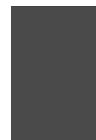
„D3” szary diamentowy