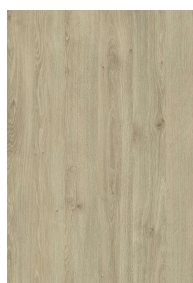
„D11” dąb davos naturalny