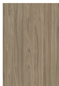
„D12” orzech carini