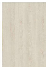
„D10” sosna aland