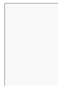
„D1” biały premium