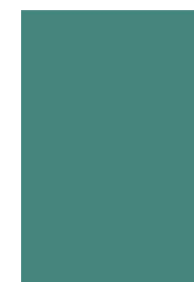
„F6” turkus RAL 6033