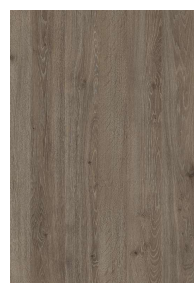
„D13” dąb davos truflowy